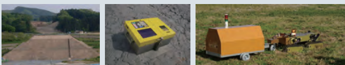
盛土 盛土の品質管理を行う計器 RI密度水分計「ANDES」 本体 10.5kg + 線源棒 2kg 計器を搭載した台車を連結した「健気」