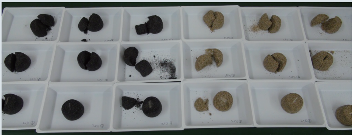
強度試験後の試験体