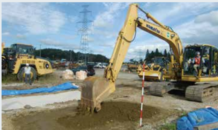
実機を用いた掘削実験