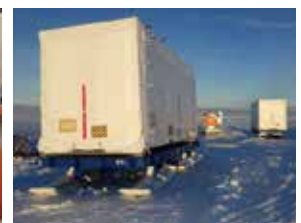
昭和基地への陸揚げ (2020年1月)