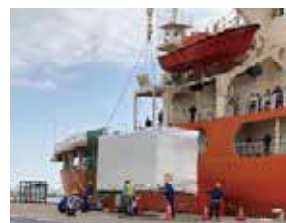
砕氷艦しらせへの搭載作業 (2019年11月)

今年度の南極地域は雪不足のため、一部の実証スケジュールに遅延が生じているが、引き続き各技術要素の有効性の実証を進める。