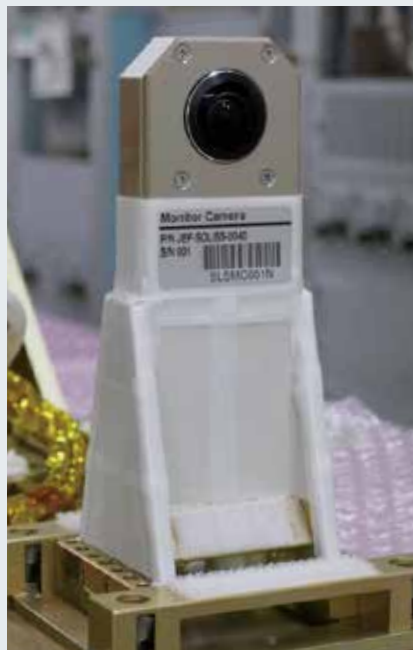
図1 宇宙用全地球カメラ SOLISSのモニタカメラとして 組み付けられた状態

2020年5月まで軌道上実験が続けられ、現在は「きぼう」の中で保管されている。2020年度内に地球に戻ってくる計画であり、約半年の軌道上実験を終えた全地球カメラを地上で分析し、将来ミッションに応用するための評価を実施する。