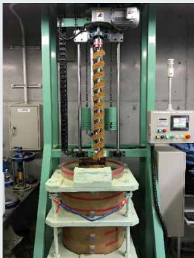
写真1 地盤定数の推定手法の検討に使用した掘進制御の可能な大型掘削試験機

地上工事では、地盤の飽和・不飽和条件、砂、粘土等の地質条件、礫分含有量等の条件が、地盤特性の逆推定に影響を与える可能性がある。このため現場検証試験と並行して、室内掘削試験でも地盤条件の違いによる推定結果への影響の検証を進めており、これらの結果をもとに、本推定手法の適用性検証および推定精度の向上を図る予定である。