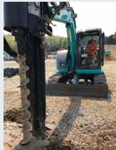
写真3 現場検証試験の状況（杭基礎工事をイメージ）