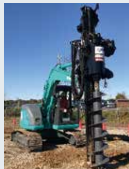
写真2 現場検証試験用の原位置掘削試験機