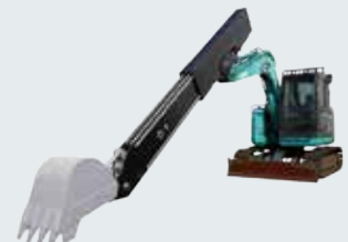
7tonクラス油圧ショベル用 CFRP製テレスコープアーム 油圧ショベル取付状態（実物）