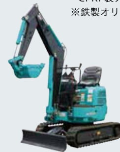
1tonクラス油圧ショベル用 CFRP製アーム・ブーム 油圧ショベル取付状態（実物）