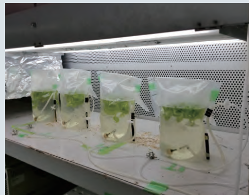
袋培養による栽培状況（常圧）