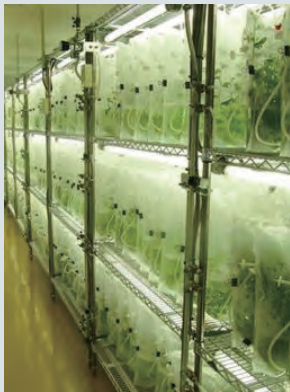
袋培養のイメージ

袋培養による、ウイルスフリー苗および葉菜可食部の栽培可能性と、必要な資材量の基本データを取得する。月面等を想定した場合に、低圧での栽培が可能であれば、施設建設資材の軽減と運用エネルギーの低減が可能であるため、低圧環境での栽培可能性についても評価を行う。これらの結果を踏まえて、設定人数に対する必要栄養成分を想定した、全体システムの規模を試算する。