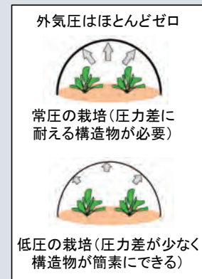
低圧栽培の考え方