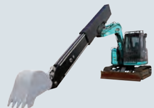
7tonクラス油圧ショベル用 CFRP製テレスコープアーム 油圧ショベル取付状態（実物）