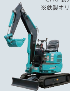
1tonクラス油圧ショベル用 CFRP製アーム・ブーム 油圧ショベル取付状態（実物）