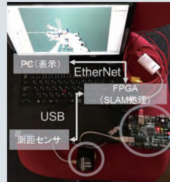
省電力型ロボット計算機システムの検討