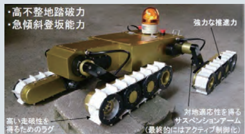
マルチクローラ探査ロボット「健気」