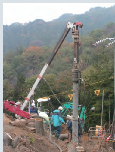
写真3 杭基礎工事例