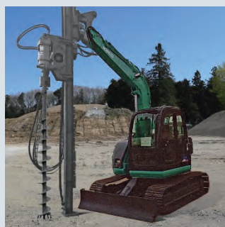
写真2 現場検証試験用の掘削試験機イメージ