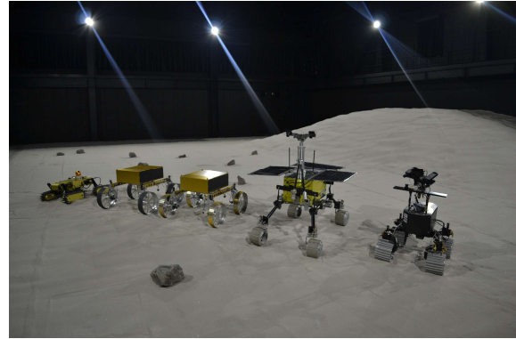
宇宙探査フィールドに集合したJAXA探査ローバ