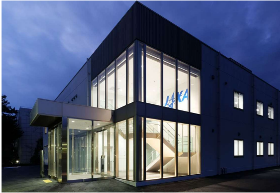
宇宙探査実験棟 外観