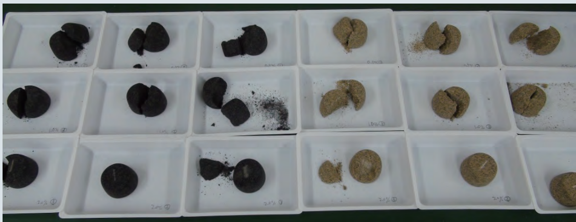
強度試験後の試験体